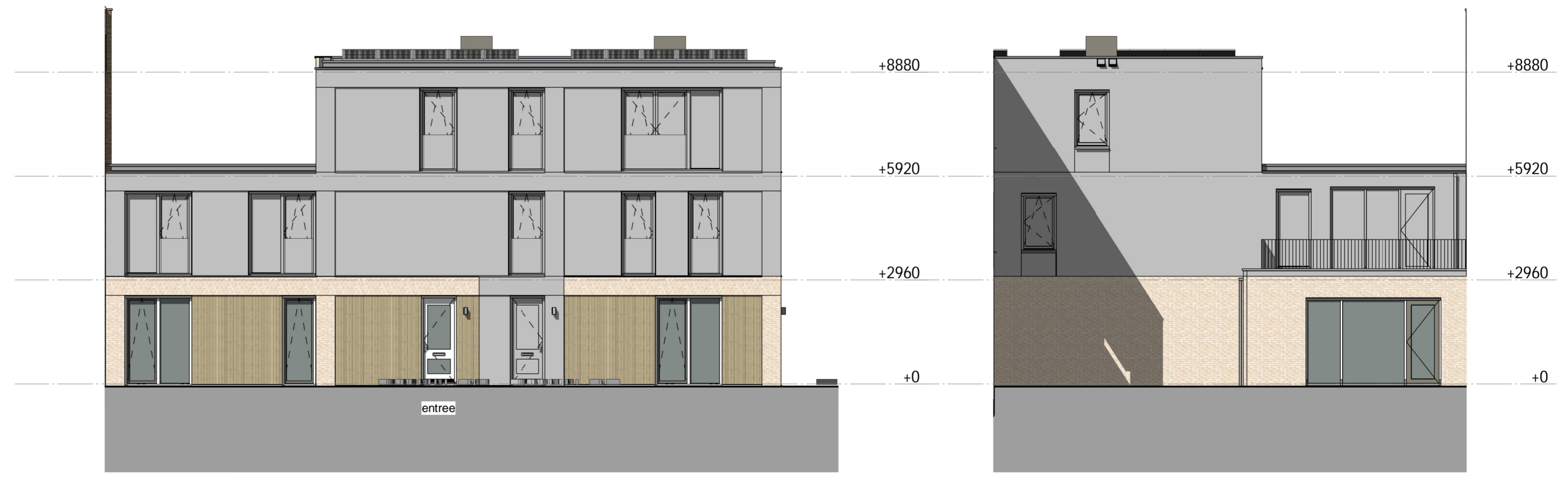
voorgevel Zwartbonstraat 1 : 100